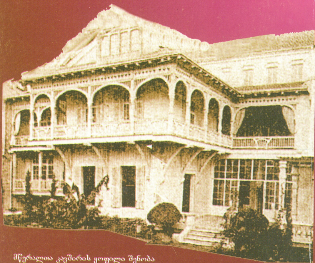
მწერალთა კავშირის ყოფილი შენობა Former Premises of the Union of Georgian Writers