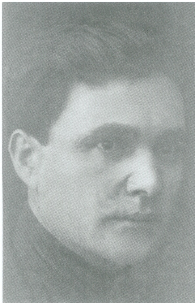
გალაკტიონ ტაბიძე Galaktion Tabidze 1892-1959