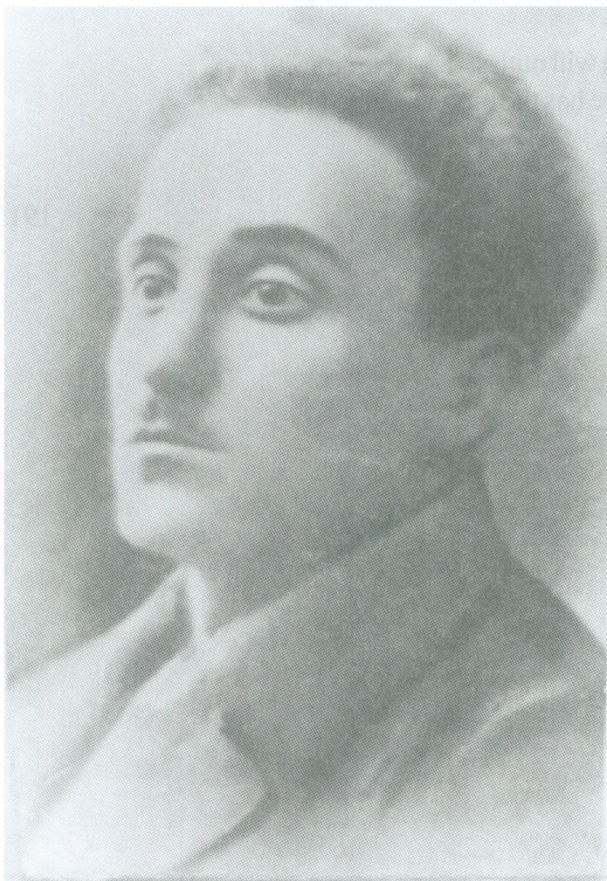
ტერენტი გრანელი Terenti Graneli 1897-1934