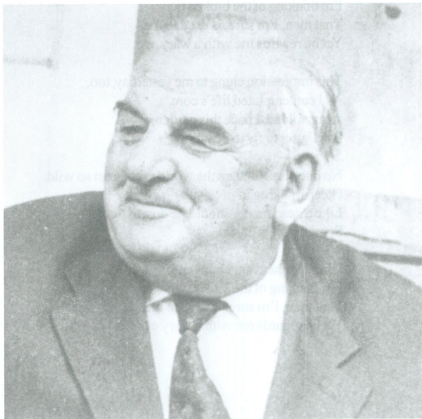
გიორგი ლეონიძე Giorgi Leonidze 1899-1966